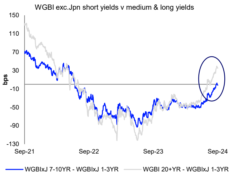
図 3: WGBI（除く日本）の短期セクターと中期、長期セクターの利回りスプレッド履歴

第 3 四半期の注目すべきもう 1 つの重要な展開は、逆イールドカーブの解消であり、Chart 3 に示すように、短期利回りが中期および長期利回りよりも低下した。このカーブのブル・スティープ化は通常、中央銀行の緩和サイクル中に発生し、WGBI（日本を除く）のカーブでは、10 年債/2 年債のイールドカーブ勾配が 2022 年以來初めてプラスに転じた。現在、長期債は短期セクターと比べて約 30 ベーシスポイントのプラスの利回りを示しており、中央銀行が政策を引き締めていたときのイールドカーブの特徴であったマイナスキャリーの反転を示している。